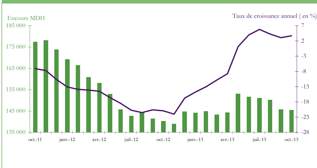
Graphique 3 : EVOLUTION DES RESERVES INTERNATIONALES NETTES